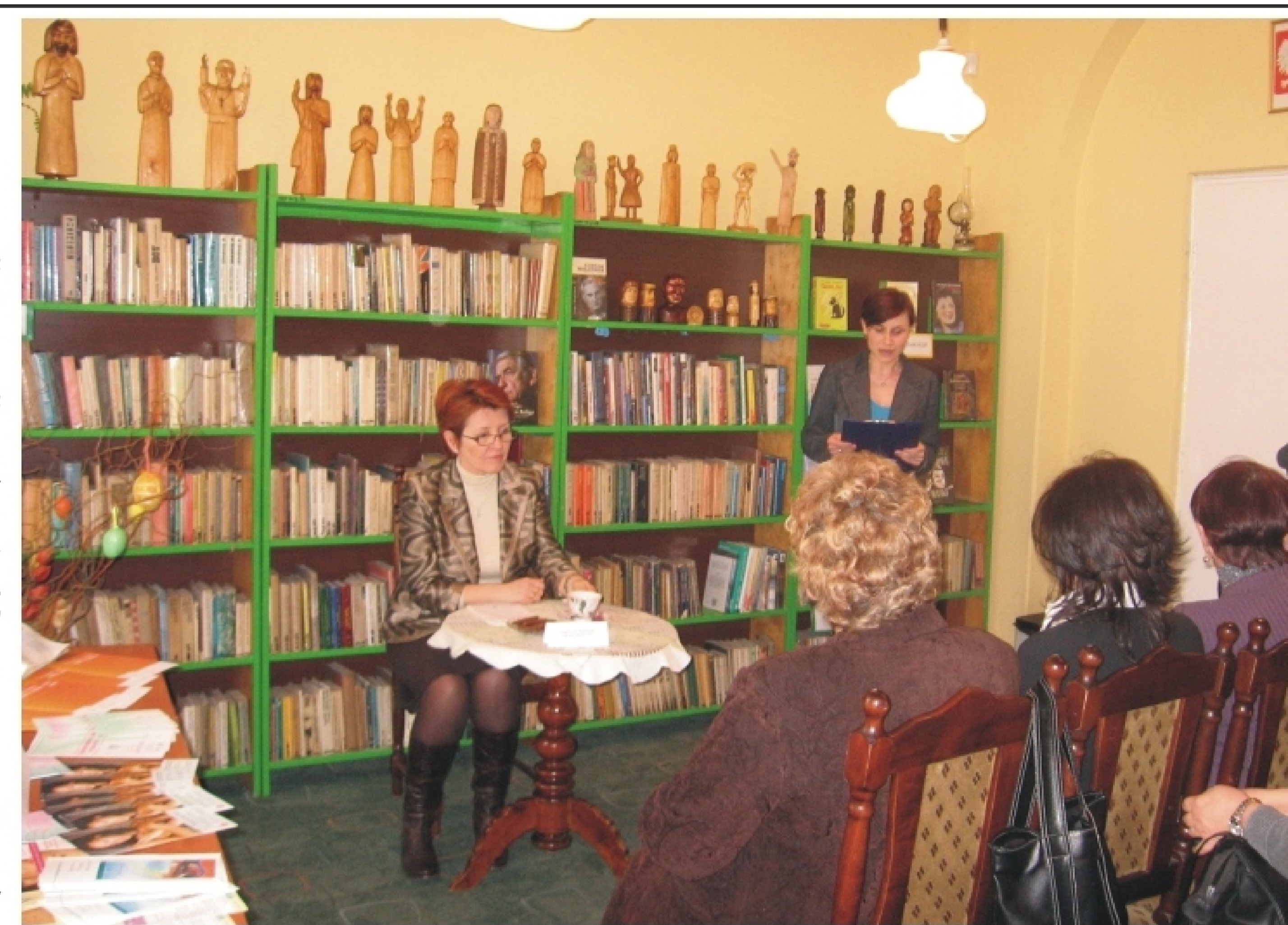
Miejska Biblioteka Publiczna zapowiada już niedługo kolejne wykłady poświęcone zdrowiu.

Za pomoc w organizacji spotkania biblioteka dziękuje kwiaciarni Państwa Elżbiety i Jana Pipeczyńskich.