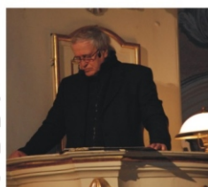
Niesamowitych emocji przysporzyła widzom nastrojowa muzyka.

Korzystając z okazji aktor odwiedził również Izbę Pamięci Poli Negri.