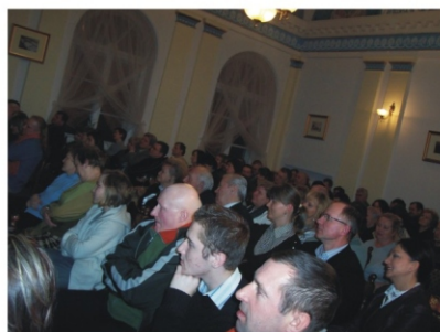
Pomiędzy opowiadaniem gość zaprezentował pokaz sztuki aktorskiej. Szczególne emocje wzbudziły u zebranych wspomnienia z planów filmowych.

22 lutego wraz z zespołem De Profundis wystąpił przed lipnowską publicznością, zgromadzoną w kościele pw. Wniebowzięcia NMP.